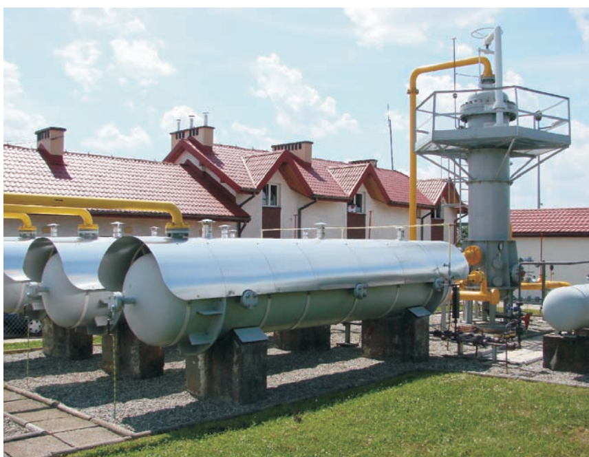
Rys. 3. Osłony termiczne zamontowane na zbiornikach magazynowych glikolu

Do poprawy regeneracji glikolu możemy doprowadzić poprzez wprowadzenie gazu strippingowego. Gaz ten wprowadza się do przewodu przelewowego, łączącego reboiler ze zbiornikiem magazynowym, który zwykle wypełnio-