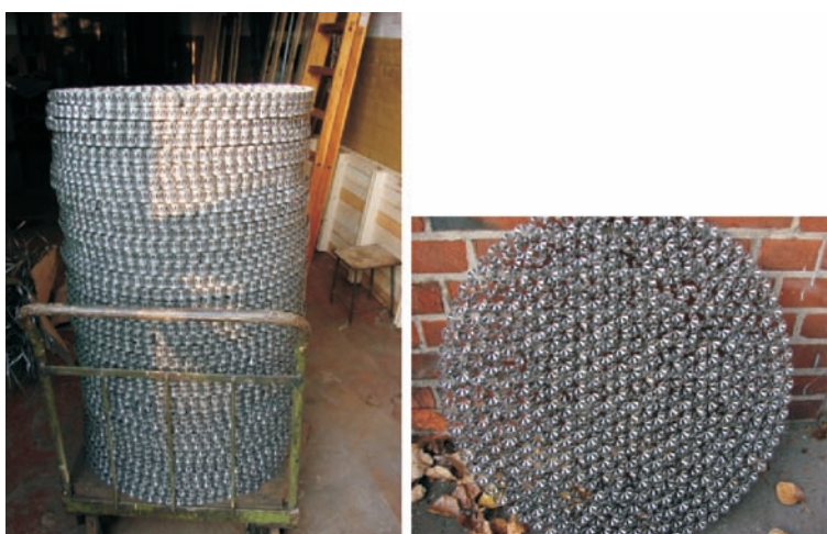
Rys. 1. Wypełnienie kolumny wykonane z pierścieni Białeckiego

Proces osuszania glikolowego prowadzi się w kolumnie kontaktowej, gdzie gaz przepływa w kierunku górnym przez wypełnienie lub półki. Jak wykazały wieloletnie doświadczenia, wypełnienie ma duży wpływ na zapewnienie dobrego kontaktu gaz-glikol. Wykonane wypełnienie ułożone (np. pierścienie Białeckiego) jest obecnie jednym z lepszych i tańszych rozwiązań, zapewniającym dobre zwilżanie przez glikol całej powierzchni wypełnienia kolumny.